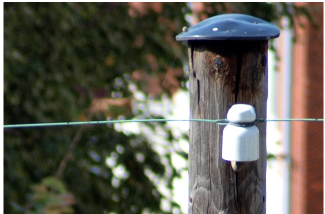
Samme billede men et 100% crop