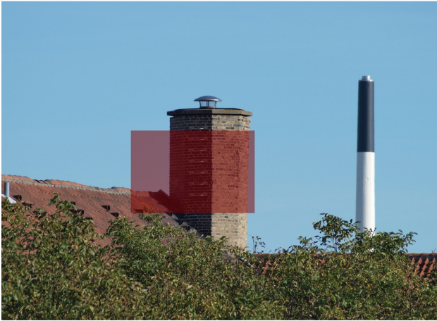
Skorsten på 210mm, f/5,6 og 1/400 sek. Afstanden er omkring 200 meter. Resized: