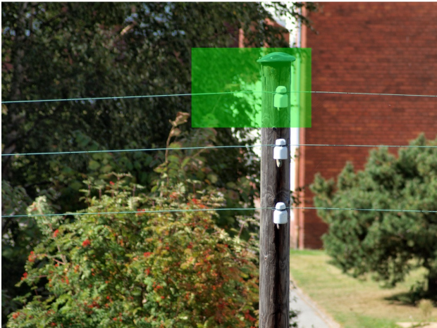
Lygtepæl på 210mm, f/5,6 og 1/160 sek. Afstanden er omkring 35-40 meter. Resized: